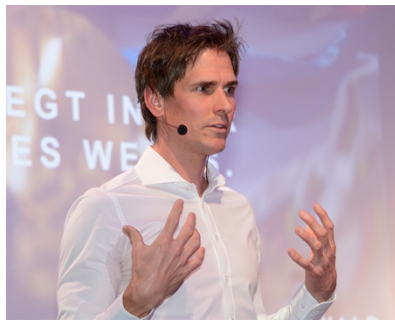
FELIX GOTTWALD erfolgreichster österreichischer Olympionike aller Zeiten

SPORTS. election Legends. Marketing. Events